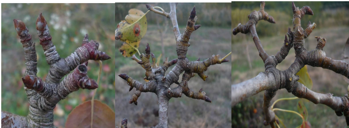
Distintos tipos de bolsas.

Las bolsas no deben ser podadas, salvo que generen una proliferación frutal excesiva capaz de debilitar al árbol desecándolo por agotamiento.