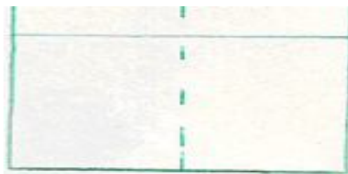
Fig-a. Recipiente con membrana semipermeable

¿Pero en que consiste ésta? Veámoslo seguidamente. Colocamos en un recipiente de agua una membrana semipermeable (Fig-a).