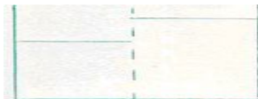
Fig-B. Perdida de uniformidad del agua

Seguidamente disolvemos en el agua sales minerales. Las sales ejercen un potencial electroquímico que atrae hacia si las moléculas de agua dándonos como resultante un incremento del volumen en la porción del recipiente que hemos disuelto las sales (Fig-b, lado derecho).