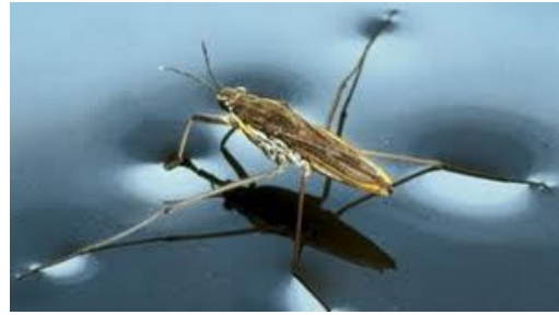
Insecto reposando en el agua

Si observamos a determinados insectos en un estanque o charca veremos que estos son capaces de permanecer estables encima la superficie del agua dándonos la impresión que para el insecto el agua se comporta a fines prácticos como un sólido.