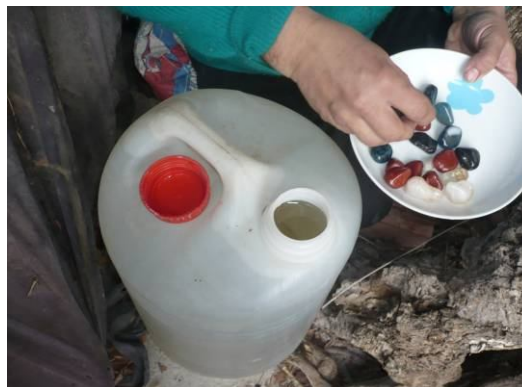
Reactivación de la memoria del a agua mediante gemas.

La presión generada en el como consecuencia del incremento de volumen sobre el recipiente es equivalente y medible en términos de presión atmosférica y recibe el nombre de presión osmótica. Para volver al equilibrio inicial podemos hacer dos cosas: modificar el volumen del recipiente aportando o extrayendo agua, o bien ejercer una presión que neutralice a la presión osmótica.