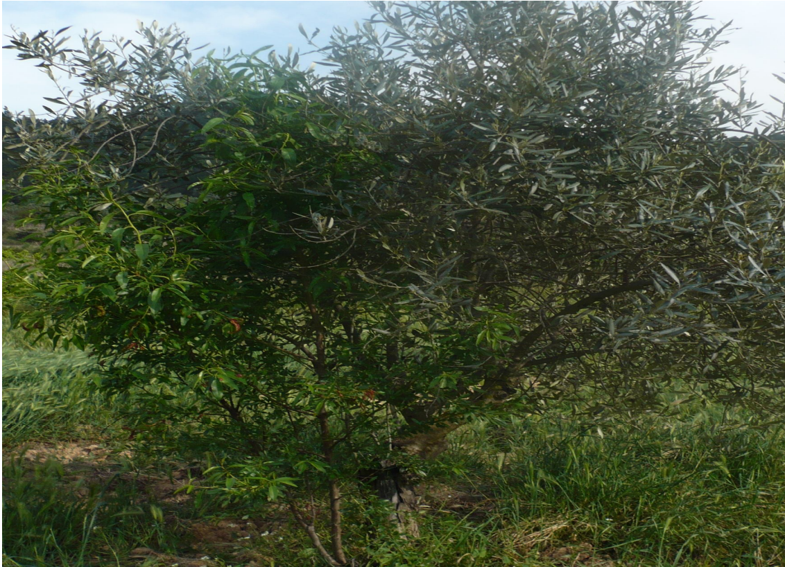
Una Historia de Amor